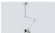
LED 30 C