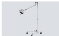
LED 30 F