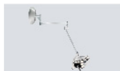
LED 30 W