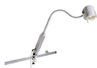
50 P SX