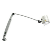
50 P FX